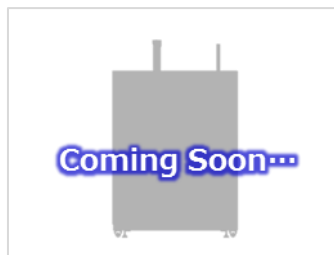
エアリークテスト装置