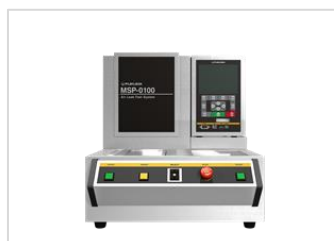
エアリークテスト装置