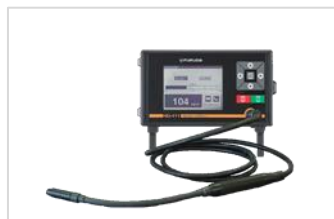
水素リークディテクタ